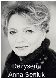
Reżyseria Anna Seniuk