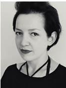
Scenografia Marta Kodeniec